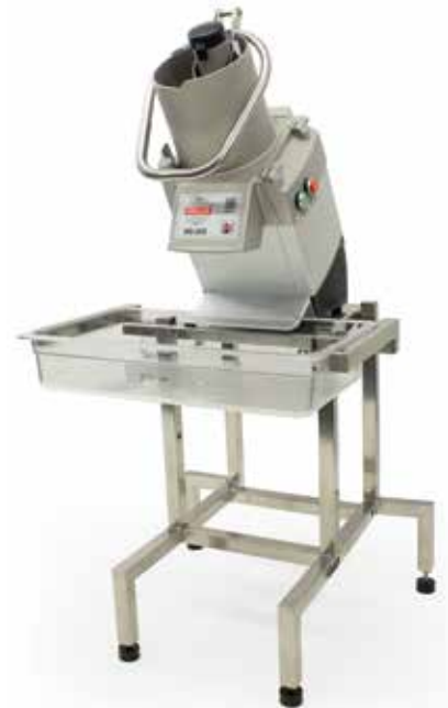
Maskinbordet är flexibelt och kan regleras i tre olika höjdlägen för att säkerställa en ergonomisk arbetshöjd.