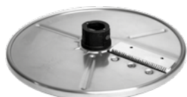
JULIENNE SCHEIBE 2x2 mm