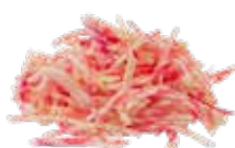
Geringelte Rote Beete