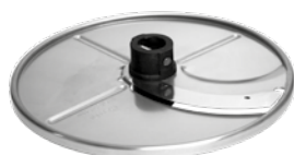
PLASTER 4 mm