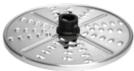
WIÓRKI 6 mm