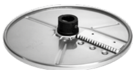
SŁUPKI 4x4 mm