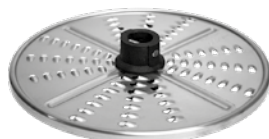
WIÓRKI 4 mm