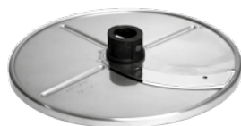
PLASTER 2 mm